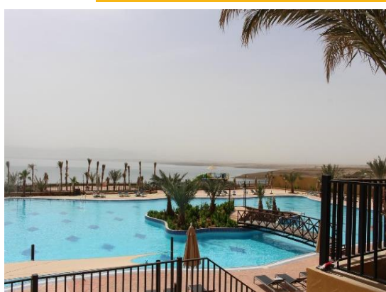
Grand East Hotel Spa Dead Sea, 4* - www.grandeasthotelspadeadsea.com-jordan.com