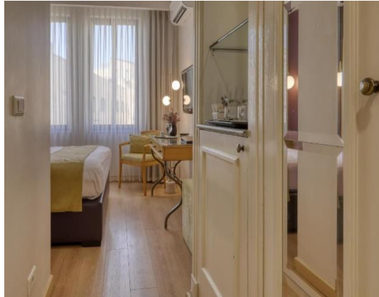
Hotel Liwan, Amman 3* eller lignende - www.theliwan.com